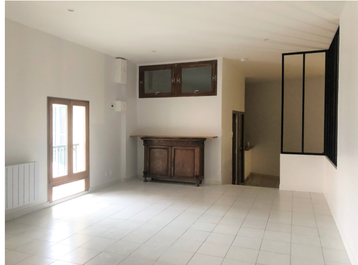
A LOUER - GROSLAY F2 de 75.14 m 2 à 850.00 € CC

Provisionnelles mensuelles avec régularisation annuelle